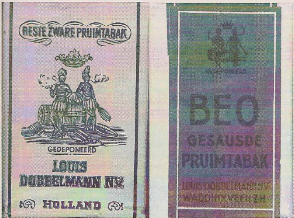
Afbeelding 1: Etiketten van Louis Dobbelman pruimtabak